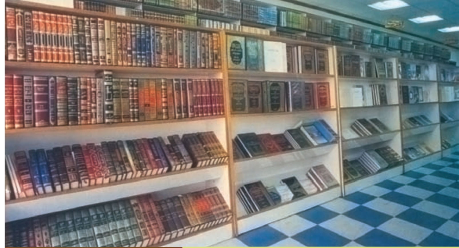
كتب : ذياب عبدالكريم

ومن أهم الموضوعات التي سيطرحها هذا المعرض: ما الإسلام؟ والأدلة على وجود الله، وأهمية التوحيد وبطالان الشرك، وأعمدة الإسلام والإيمان، والحياة بعد الموت، وحثمية الحياة الأخروية، وأنبياء الله، وحياة محمد صلى الله عليه وسلم، وحياة المسلم، والافتراءات على الإسلام، وهل الإسلام دين تطرف وإرهاب؟