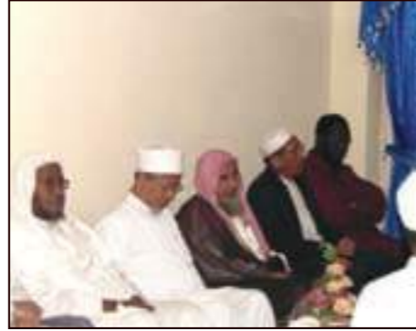
الجلسة الافتتاحية للدورة الشرعية العاشرة