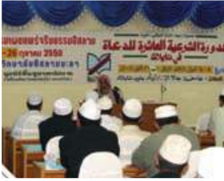
كلمة الدورة ألقاها فضيلة الشيخ فهد بن عبدالرحمن الشويب