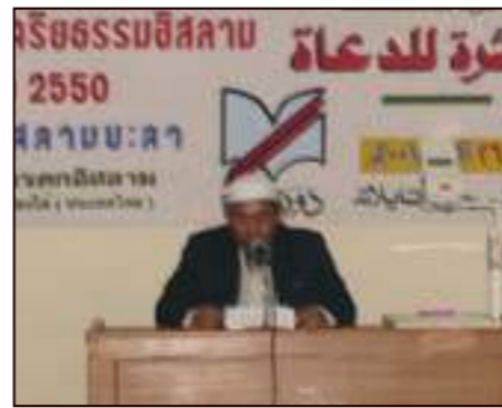
كلمة ترحيبية ألقاها المشرف العام لمكتب اللجنة - تايلند-