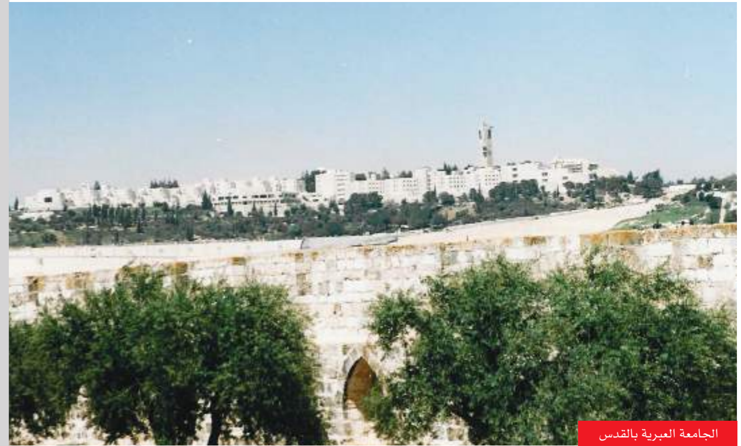
الجامعة العبرية بالقدس