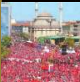
الفرقان / القاهرة من أحمد عبد الرحمن

وقد أنهى هذا الترشيح أزمة شديدة عاناها الحزب في الأشهر الأخيرة وكادت هذه الأزمة أن تعصف بالتجربة الرائدة التي امتاز بها الحزب في السنوات الأخيرة، وهي التناغم الكبير بين زعيم الحزب رجب طيب أردوغان وعبد الله غول بعدما ترددت أنباء عن أن أردوغان كان يفضل أن يتخذ غول قراراً بسحب أوراق ترشيحه من السباق الرئاسي حتى لا تدخل البلاد في أزمة سياسية جديدة نتيجة تحفظ الأتاتوركين والعلمانيين والأحزاب القومية على ترشيح غول، ذي الخلفية الإسلامية في ظل ارتداء زوجة غول للحجاب مثل زوجها أردوغان، الذي كان يفضل أن يقدم مرشحاً لا ترتدي زوجته الحجاب مثل وزير الدفاع وجدي غونول وغيره من المسؤولين.