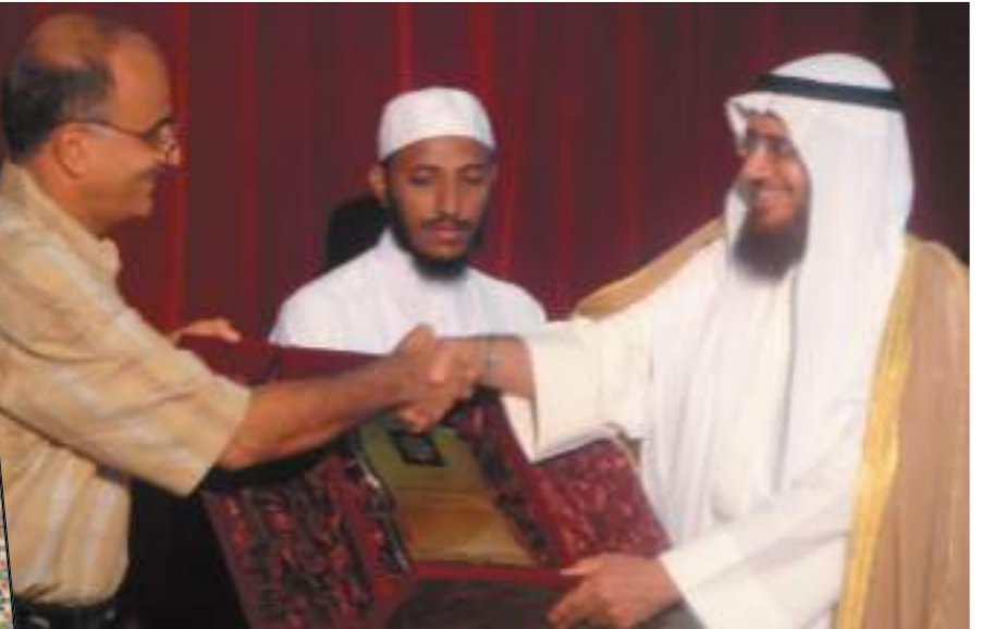
تقديراً لدعمه المشاريع العلمية واعترافاً بجهوده الشخصية