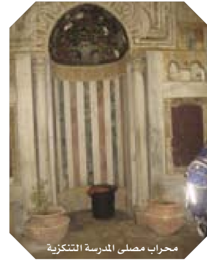
محراب مصلى المدرسة التنكزية

أنشأها الأمير سيف الدين تنكز بن عبد الله الناصري ، ووقفها في سنة (٧٢٩ هـ/١٣٢٨م)، كما هو ثابت في نقش كتابي كتب على واجهتها الخارجية، فوق الباب الشمالي؛ وقد وصفها "مجير الدين الحنبلي" في الأنس الجليل (٧٨/٢) بأنها مدرسة عظيمة ليس في المدارس أتقن من بنائها ووقف الأمير تنكز الأوقاف الكثيرة