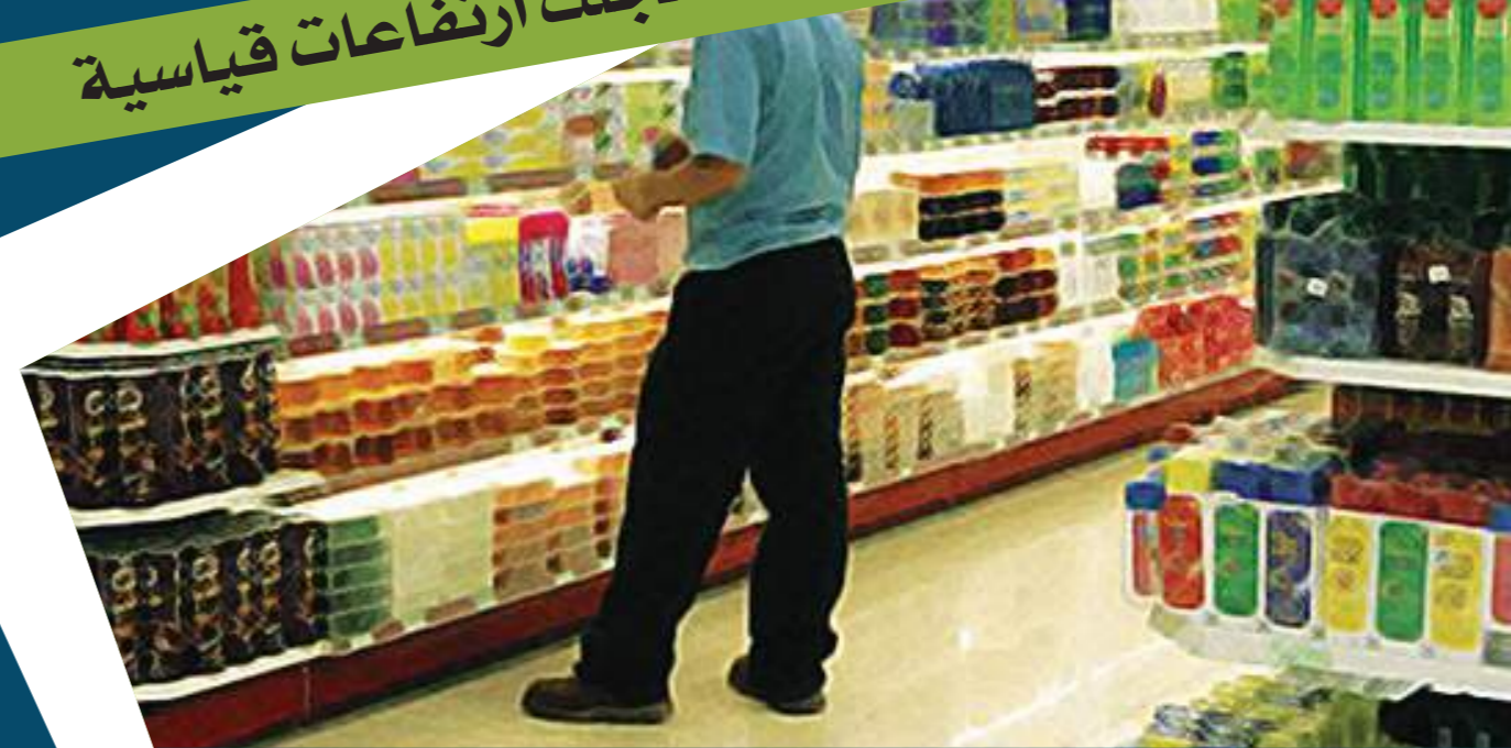
شعوب المنطقة بين مقصلة الاحتكارات وضغوط الغلاء