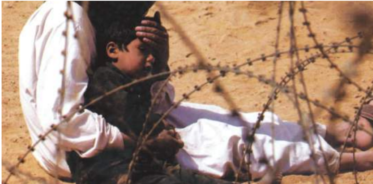
١٣٠٠ طفل عراقي في معتقلات الاحتلال و ١١ ألفاً يعالجون من إدمان المخدرات