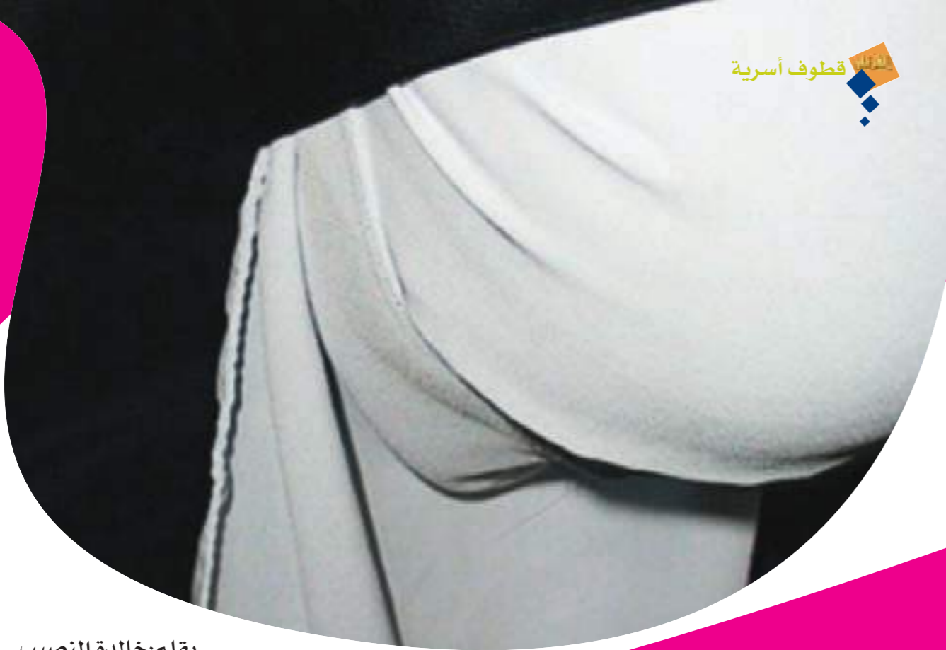
بقلم: خالدة النصيب