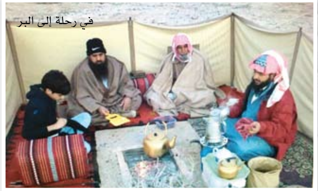
في رحلة إلى البر