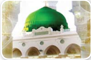
٣٠ محاسن الرفق وآثاره الطيبة