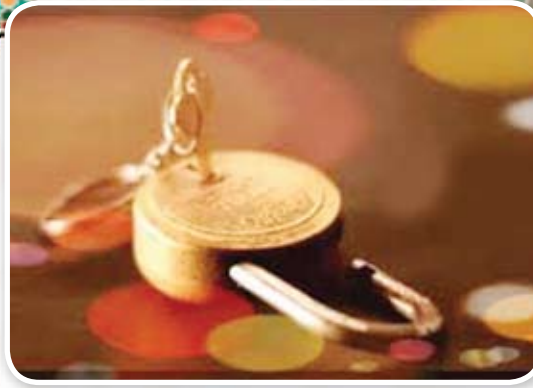
١٧ الأمانة من الأسس التي قام عليها ديننا الحنيف