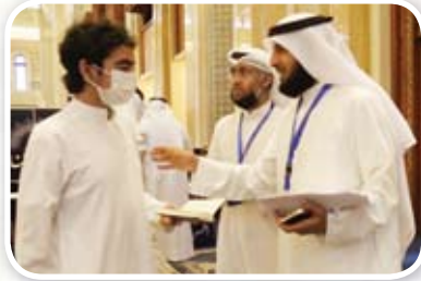
١٤ الظفيري: إحياء التراث تسعى لإثراء الساحة بالنماذج القرآنية