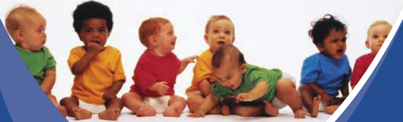
بقلم: هيام الجاسم

ربما لم يواجه جنرال باكستان برفيز مشرف صعوبات تضع مصير نظام حكمه على المحك مثلما واجه هذه الأيام؛ فالمعارضة لاستمراره في سدة السلطة وتزايد المطالب بتنحيه عن قيادة الجيش لا تنتهي، والتحالفات الساعية لإسقاط حكمه تدشن على قدم وساق، المشكلات التي تواجه نظامه لا تكاد تنتهي مع الهزائم التي تلقاها من السلطة القضائية الباكستانية التي أعادت قاضي القضاة افتخار محمد تشودري لمنصبه بعد أن عزله مشرف لم يكده وقعها على مشرف ينتهي حتى جاءت ضربة أخرى تمثلت في قرار المحكمة الباكستانية العليا بالسماح لرئيس الوزراء الباكستاني السابق وخصم مشرف اللود نواز شريف بالعودة إلى إسلام آباد بعد سنوات قضائها في المنفى بالمملكة العربية السعودية، وهو الأمر الذي يجعل مشرف متيقنا من احتمال صدور حكم قضائي جديد يطعن في شرعية احتفاظه برئاسة باكستان وقيادة جيشها.